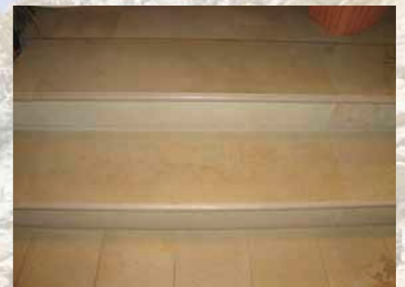
Treppenstufen als Fertigware.