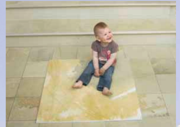
Solntec-Platte im Vergleich zum Standard-Format.