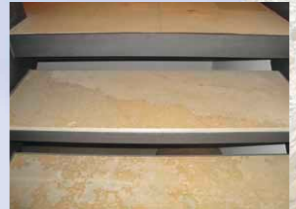
Treppenstufen als Einleger in Stahlrahmen.