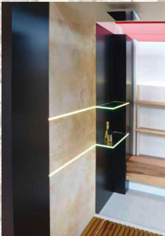
Duschrückwand, Kombination von verschiedenen Materialien.

85072 Eichstätt · Museumstraße 4 www.solntec.com · info@solntec.com