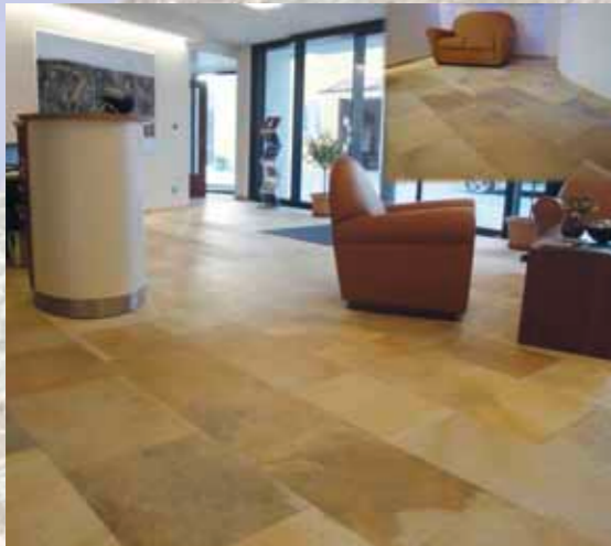
Foyer Hotel Schönblick in Eichstätt.